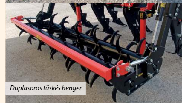
Duplasoros tüskés henger