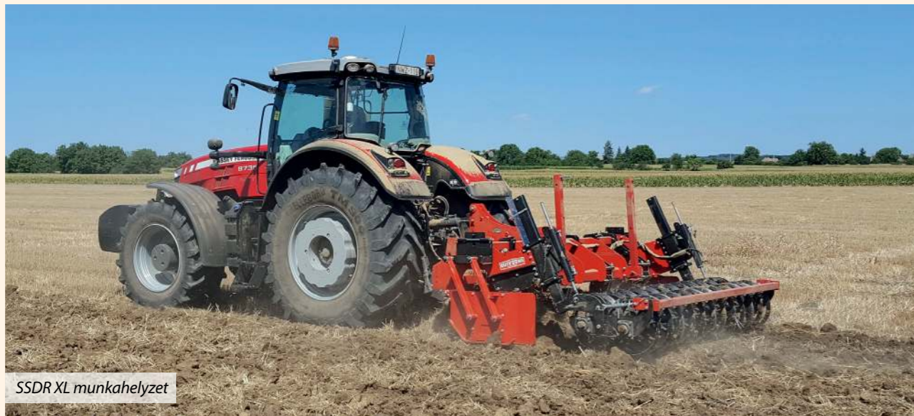
SSDR XL munkahelyzet