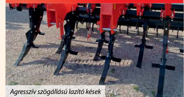
Agresszív szögállású lazító kések