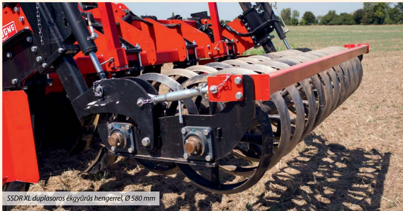
SSDR XL duplasoros ékgyűrűs hengerrel, Ø 580 mm